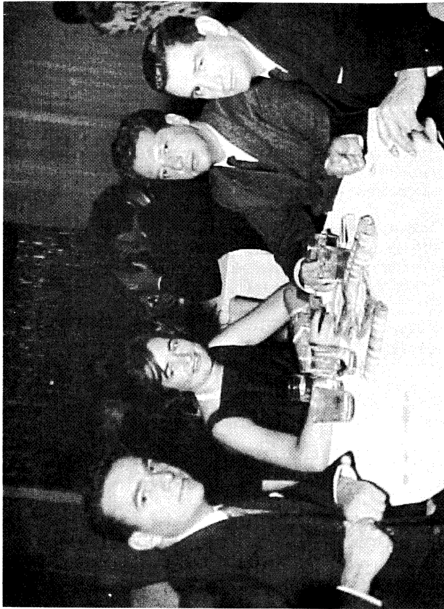
CENA EN EN EL CASINO FRANCES, GUADALAJARA JAL.